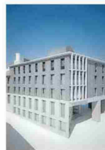
Entrada por Pontarrón.

aireará esa parte del Casco Antiguo que conectará con la calle San Antón, Pontarrón y Mediavilla, además de un ascensor urbano en Pontarrón para salvar el desnivel. Blasco hizo hincapié en cómo se va a revalorizar la calle