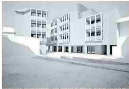
Recreación de cómo será la plaza.

Pontarrón, 7 y 9; San Antón, 16 y 24; y Plaza Vieja, 6 y su tipología es de uno, dos y tres dormitorios, con trastero. La planta de garaje tendrá capacidad para 24 vehículos.