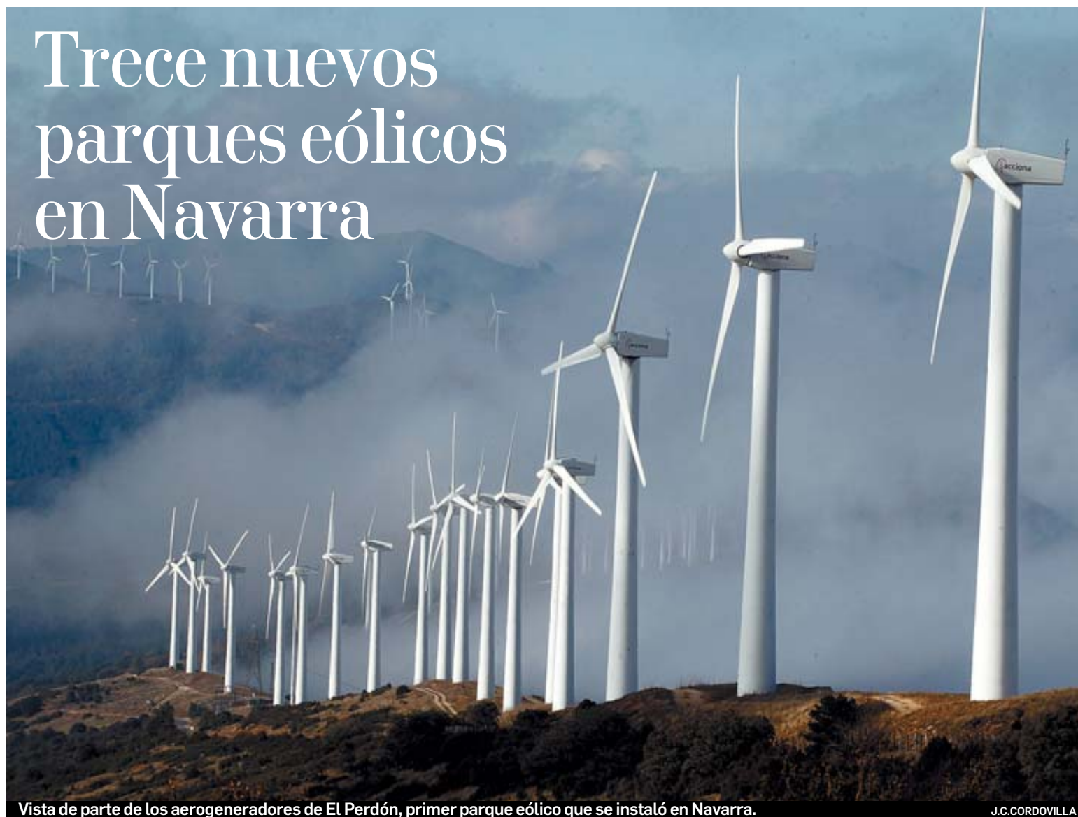
Vista de parte de los aerogeneradores de El Perdón, primer parque eólico que se instaló en Navarra.