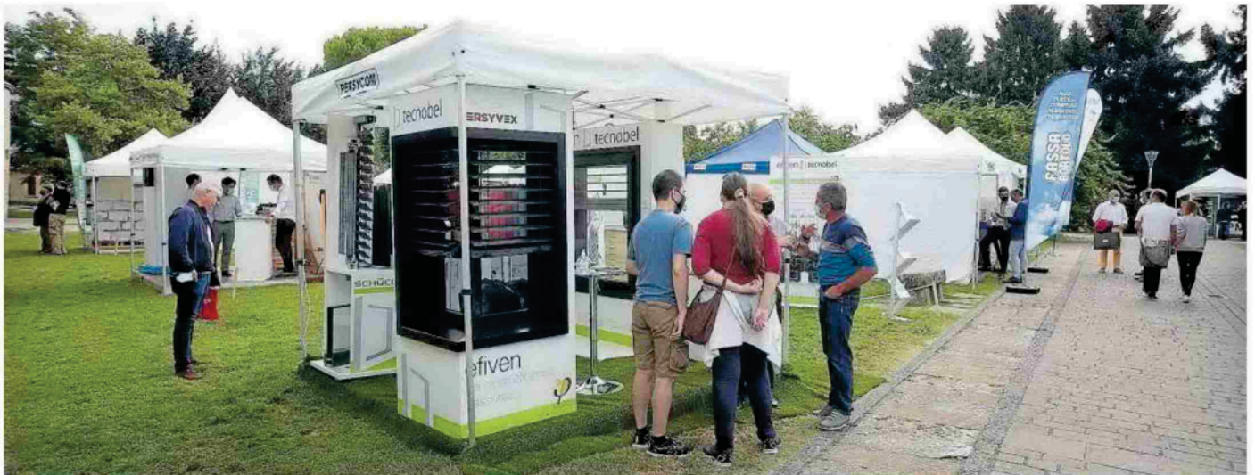
Un total de 57 empresas y entidades muestran sus productos y tecnologías estos días en la Ciudadela de Pamplona en la tercera edición de Edifíca.