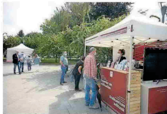
Varios visitantes se paran en uno de los expositores.

Edifíca también celebró ayer por la mañana otras mesas redondas para tratar sobre la igualdad en el sector de la construcción, sobre la eficiencia energética, el confort y salud, la sostenibilidad y circularidad. Cimientos de Igualdad consiste en una alianza