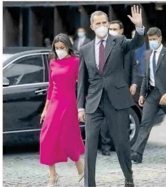
Los reyes Letizia y Felipe, a su salida de Baluarte.