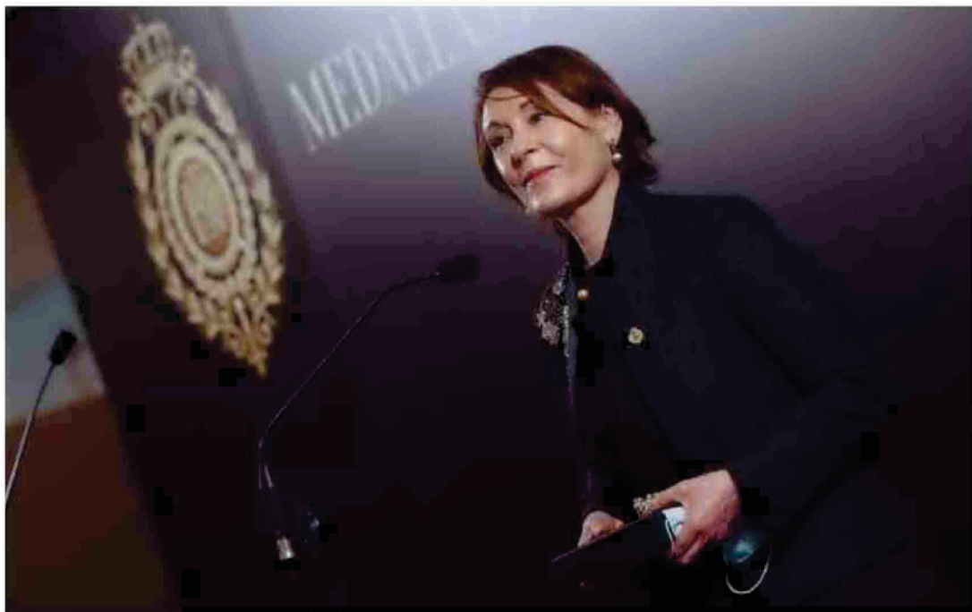
La soprano María Bayo (Fitero, 28 de mayo de 1961) dedica unas palabras tras recibir la Medalla de Oro al mérito en las Bellas Artes.

tras estar ingresado 48 días. Aseguró que no volverá a trabajar "al menos hasta después de verano" porque "no aguanta físicamente". También bromeó sobre la tarima que tenía que subir para recibir un premio que le supo "muy bien" en estos momentos. "He visto las escaleras y casi me da un infarto, agradezco que la Reina, el ministro y la presidenta hayan bajado", apuntaba. "Es un premio serio y me hace ilusión", reconoció.