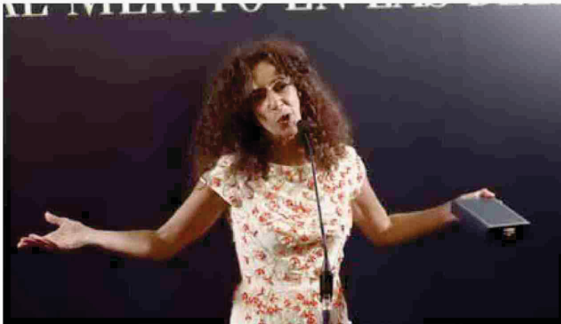
La cantante Rosario Flores, con la caja que guarda la medalla, ofrece unas palabras en el photocall.

También habló el bailarín Antonio Canales, que vestía una americana verde en honor al color de Pamplona, ciudad en la que reside su hija. "Se lo dedico a mi madre por haberme parido bailarín", apuntó. "Creo que Sara Baras y yo hemos puesto rostro al flamenco aquí, que es lo importante", manifestó. Además, tuvo unas palabras para el festival Flamenco On Fire. "Nadie daba un duro por él y se ha