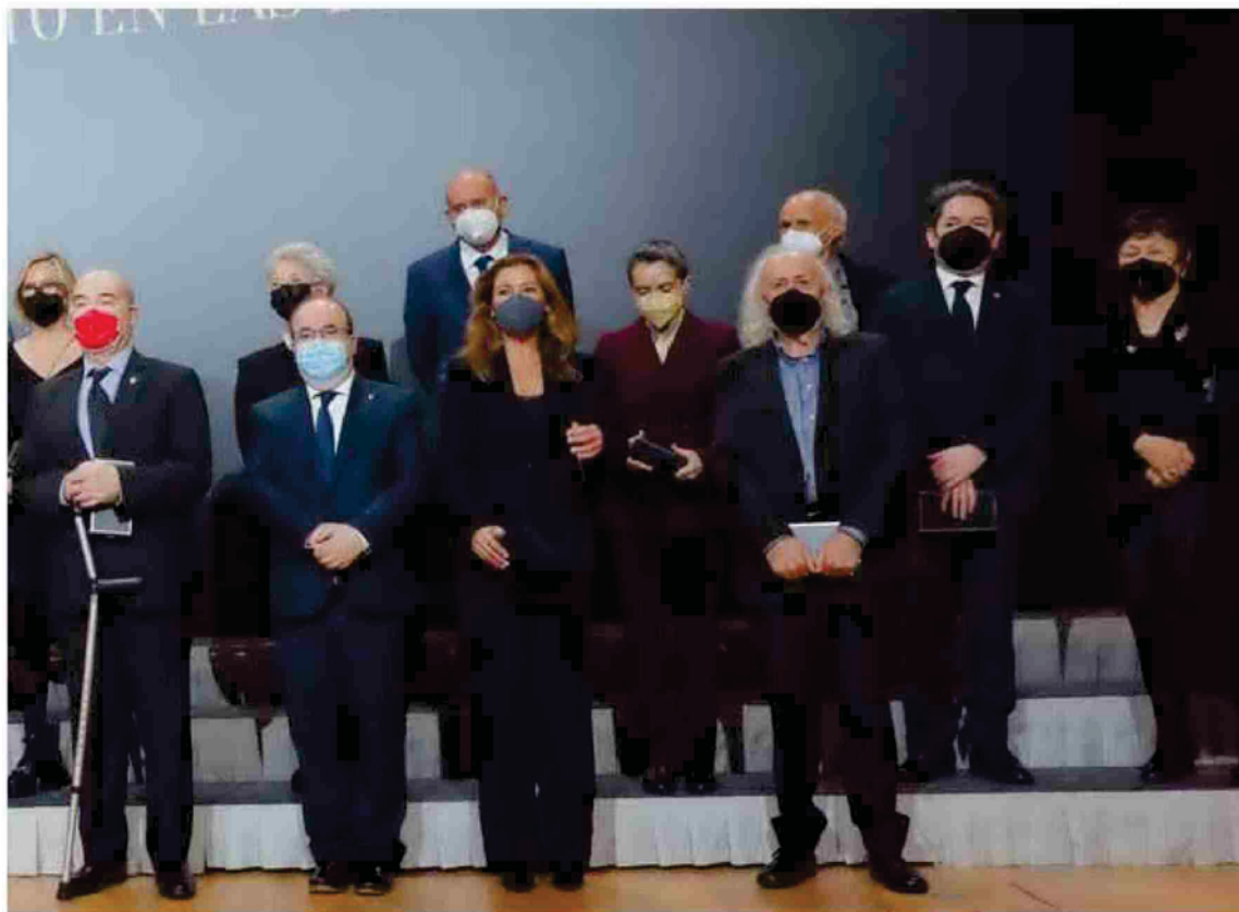
de Cultura y Deporte, Miguel Iceta.