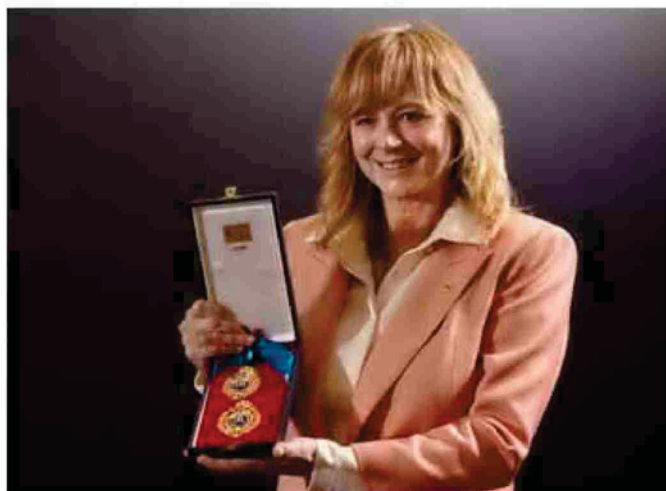
La actriz galardonada Emma Suárez posa junto a su medalla.