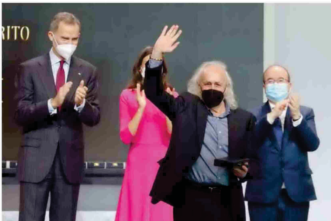
En el centro y primera línea: el director navarro premiado Montxo Armendáriz. Al fondo y desde la izquierda: Don Felipe, Doña Letizia y Miquel Iceta, ministro de Cultura y Deporte de España.