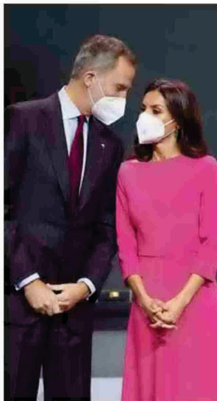
Los Reyes conversan durante el acto en Baluarte.

No se refirió a la cultura únicamente como un elemento externo, sino que ahondó en su vinculación con el comportamiento humano y social. “La belleza del arte nos muestra el camino como guía del espíritu humano a través de las emociones. Somos y tenemos la aspiración de ser mejores de lo que somos y mostrar nuestra fragilidad, nuestra vulnerabilidad”, señaló. También se refirió a la educación y consideró que la cultura “es la base esencial de una educación que nos invite a crear” e insistió en la necesidad del respeto en la sociedad para llegar al entendimiento y el diálogo “pues somos responsables en nuestra convivencia de encontrarnos y respetarnos, de crear belleza y compartirla, desde la honestidad y el amor”. La actriz tuvo palabras para su padre, al que dedicó el galardón, y finalizó su intervención con un mensaje: “muchas gracias y paz”.