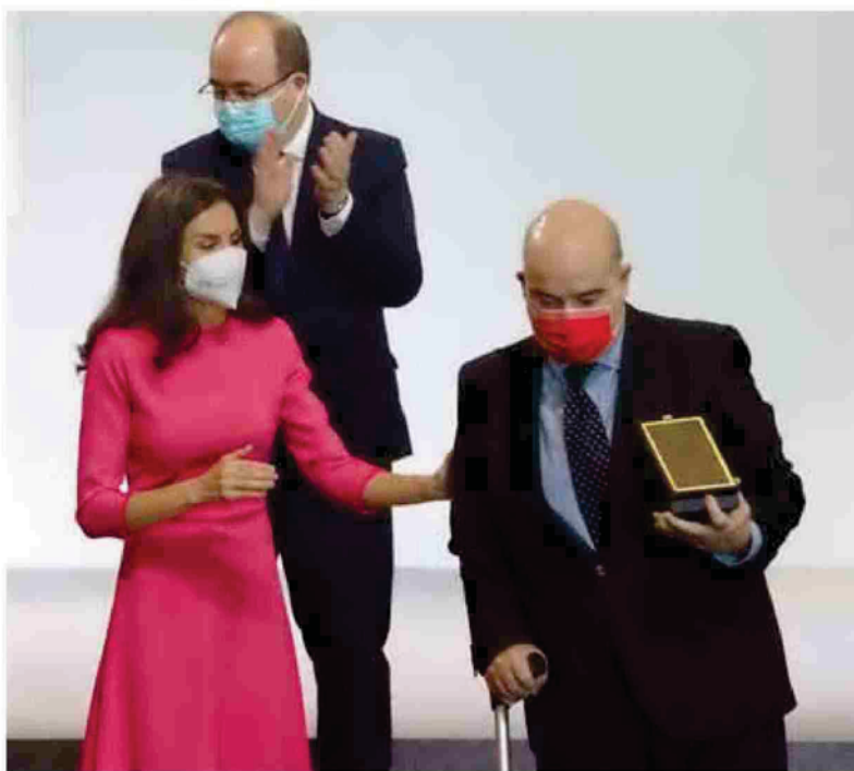
La Reina Letizia tras entregar la medalla al actor Antonio Resines, que lleva una mascarilla roja. Al fondo, Miquel Iceta, ministro de Cultura y Deporte de España.