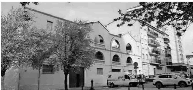
Fachada de las casas de Gridilla, cuya demolición dará paso a 28 viviendas de alquiler protegido.

Ayer, en la rueda de prensa, se les preguntó sobre plazos de ejecución de las promociones de vivienda protegida, pero aquí el equipo de gobierno quiso ser cauto. Si se adelantó que hay algunas zonas, como Txantrea sur, que están muy próximas a terminar su urbanización -se prevé que para agosto- por lo que para finales de año se podría estar licitando los terrenos, al igual que en el barrio de Buztintxuri, en el solar que asoma a la avenida Guipúzcoa y que linda con Artica. Como también es inminente el derribo de las casas de Gridilla.