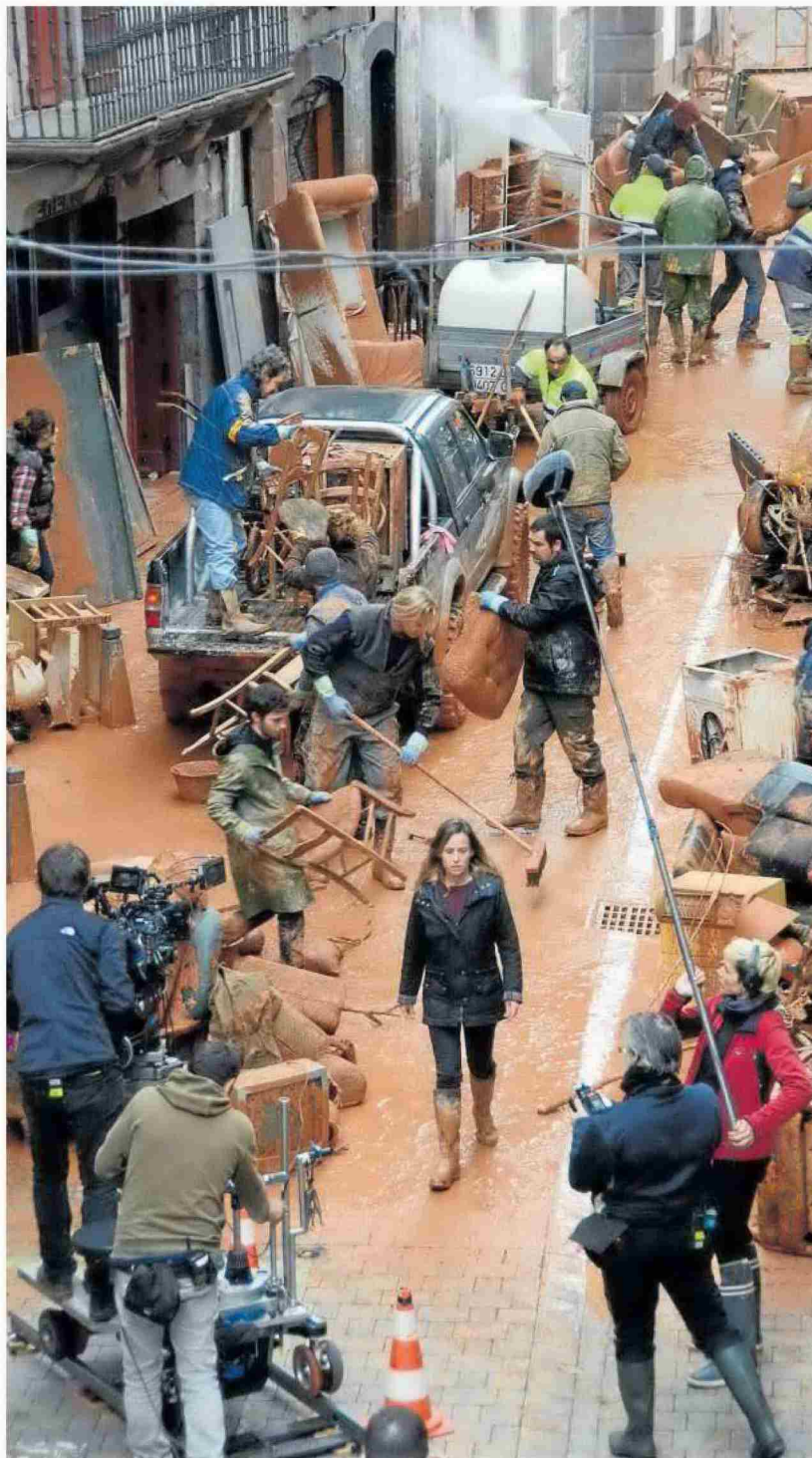
Rodaje de 'Legado en los huesos' en noviembre de 2018 en Elizondo.