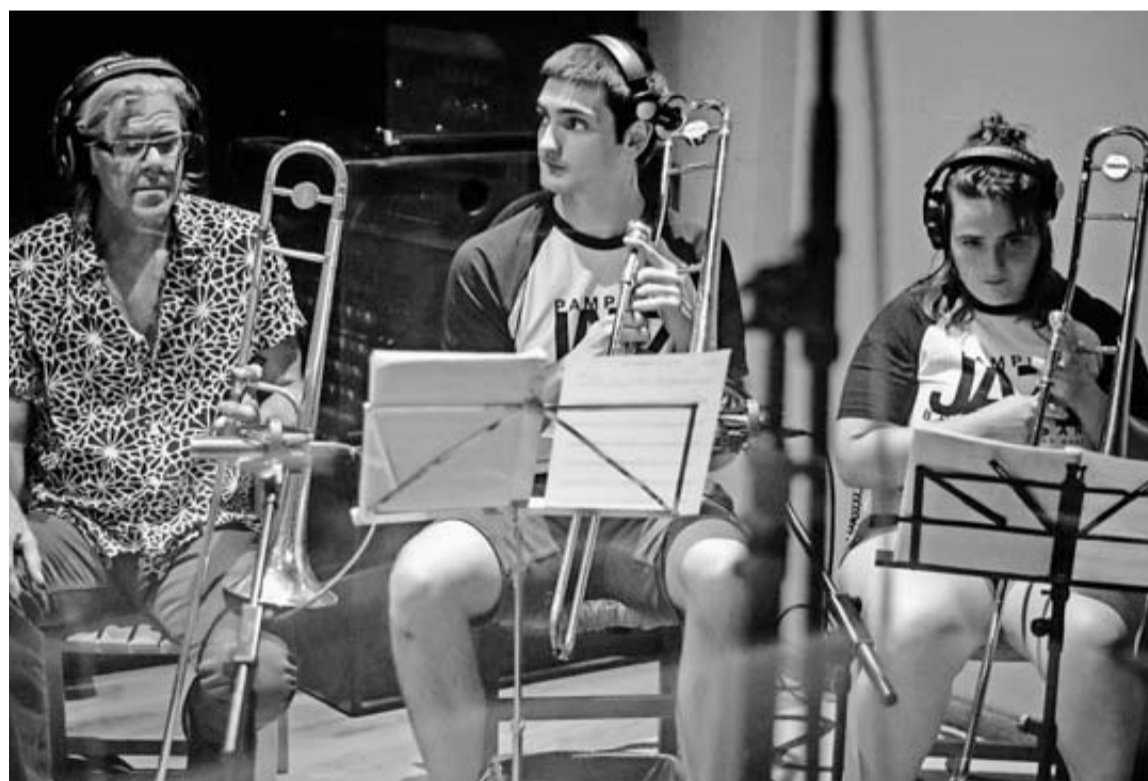
Un momento de la grabación del disco de la Iruña Jazz Brass Band con Craig Klein.

Se da la circunstancia, además, de que mientras la industria se ha replegado (a excepción de las empresas de animación digital) ante un escenario difícil de prever, el confinamiento social ha disparado el consumo de productos audiovisuales. Por ello, el sector asegura que está trabajando en la “reactivación” de la actividad una vez que se haya superado la crisis, gracias a los creadores y profesionales responsables de contenidos, que están trabajando desde su casa “generando nuevas ideas y desarrollando proyectos”.