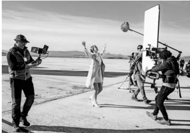
La actriz Ingrid García Jonsson, el pasado diciembre, durante el rodaje del musical 'Explota explota' en la pista del aeropuerto de Noáin.

Según sus datos, un 93% de los encuestados (de los cuales un 50% son trabajadores autónomos y un 37% forman parte de una sociedad limitada) señalan que la crisis va a tener efectos negativos o muy negativos en su empresa o labor profesional y un 68% ya ha visto paralizados sus proyectos sin estimación de fecha de reinicio. Además, un 25,6% tiene paralizada al 100% su actividad y el 73,3% ha reducido la misma por debajo de la mitad.