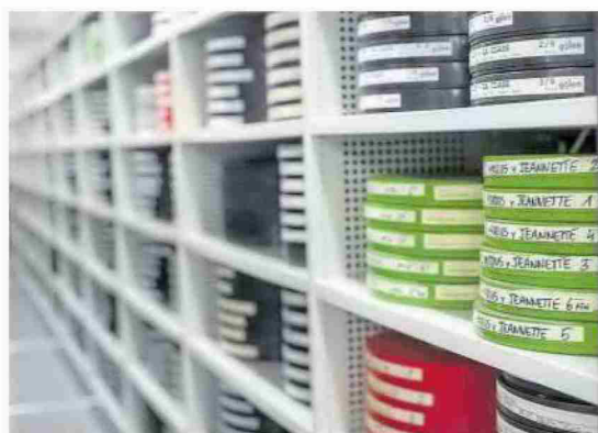
Cintas de 35 mm, en uno de los pasillos del depósito del archivo.

La película más antigua que se conserva en este archivo es una visita de Alfonso XIII en 1912, casi cien años atrás, y a partir de ahí hay numerosos documentos en formato magnético,