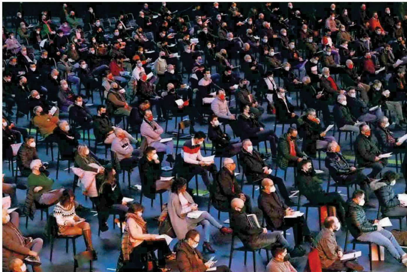
Parte de los asistentes que se congregaron el día 31 por la mañana en la pista central del Navarra Arena.