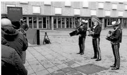
Los tres mariachis, en la puerta de acceso al Navarra Arena. DN

Tres mariachis, ataviados con el tradicional traje mexicano, pusieron la nota cómica en los aledaños del Navarra Arena. Los músicos fueron contratados por un grupo de aficionados, como denuncia por las recientes elecciones a compromisarios. En ese tono de sorna, los mariachis entonaron típicas rancheras como El Rey o Volver, Volver. La junta directiva, que accedió a la vez, se lo tomó con humor. DN