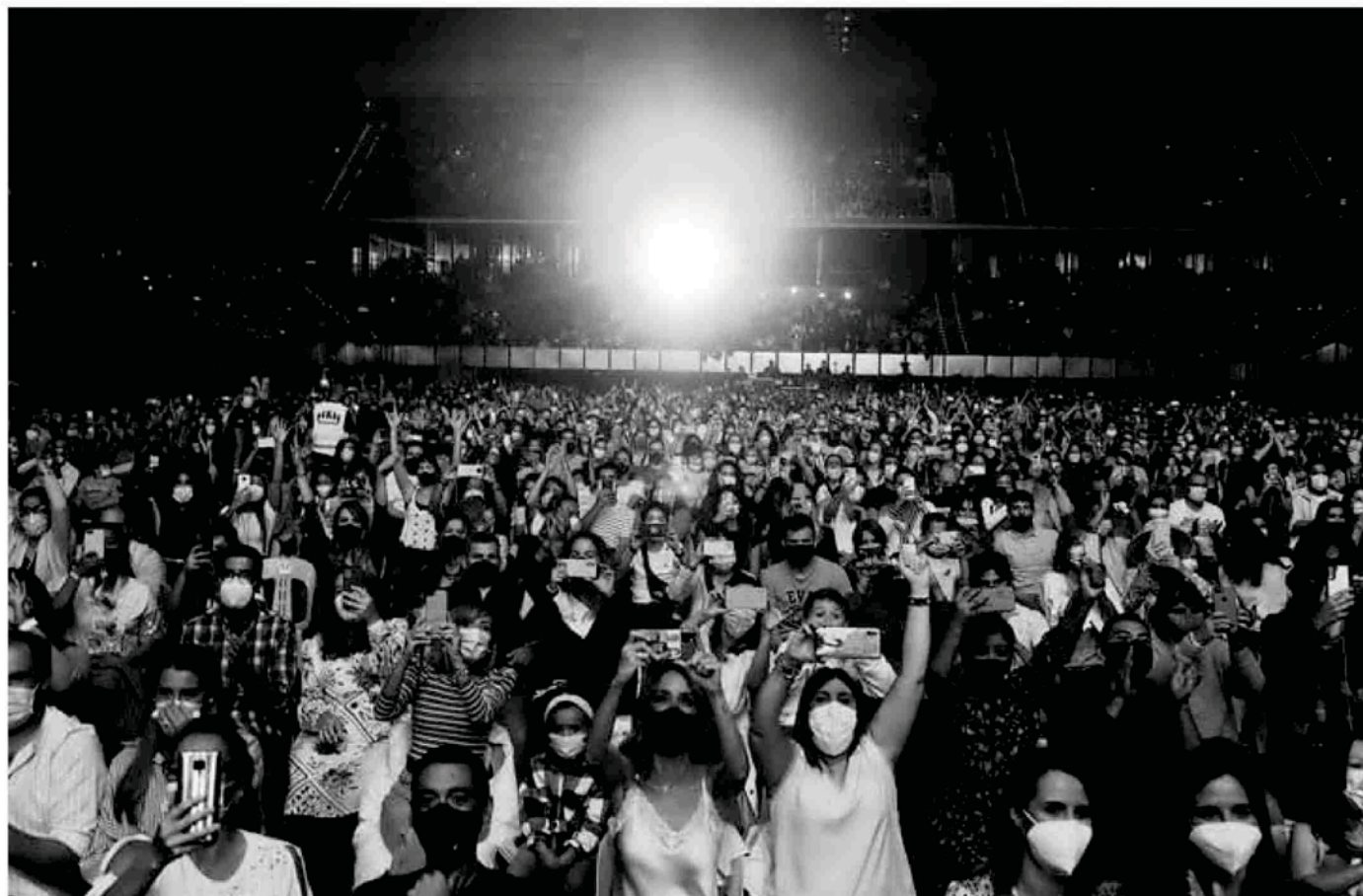
El público en el concierto de Camilo, que se celebró en el Navarra Arena en septiembre.