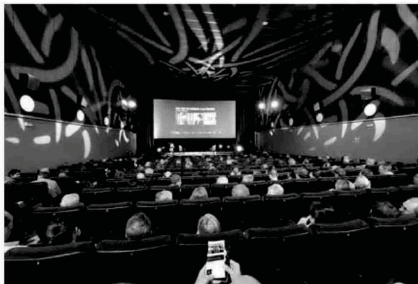
Una imagen del cine Moncayo de Tudela.

El presupuesto marca con las siglas MRR (mecanismo de recuperación y resiliencia) las inversiones que vienen de los fondos europeos que llegan a Navarra a través del Gobierno central. En el caso de la cultura, el primero que aparece tiene una dotación de 211.000 euros y se le ha bautizado como apoyo a la aceleración cultural. Según señalaron desde el Ejecutivo, se trata de acciones para favorecer la profesionalización del sector cultural, que incluyen formación, mentorización (acompañamiento a emprendedores por parte de profesionales consolidados), desarrollo industrial... y al que podrían acceder empresas de todo los ámbitos culturales.