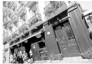
La vivienda, situada en el nº 6 de Sarasate.

PROCESOS DE REHABILITACIÓN En el texto, los grupos firmantes también recuerdan