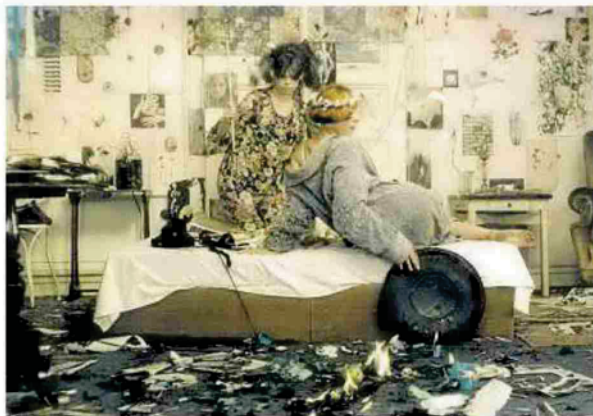
Imagen del filme ‘Las Margaritas’, dentro del Ciclo de Cine Checo.

CINE CHECO El cine checo fue especialmente destacado en el ámbito del cine infantil y de animación, contando con maestros de la talla de Jiri Trnka o Karel Zeman. Con un filme de aquella cineasta arrancará esta muestra que da